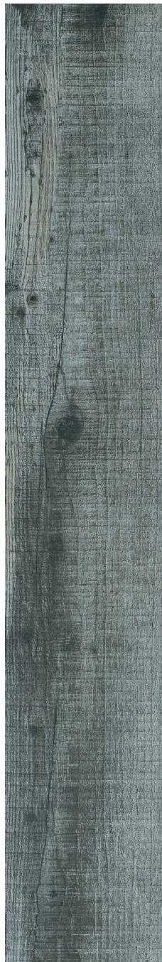
8" x 48" Mat KM.NN.CHA.0848.MT

Tous les items présentés dans ce document font partie du programme d'inventaire Olympia. Pour les commandes spéciales, veuillez contacter votre représentant de Tuiles Olympia.